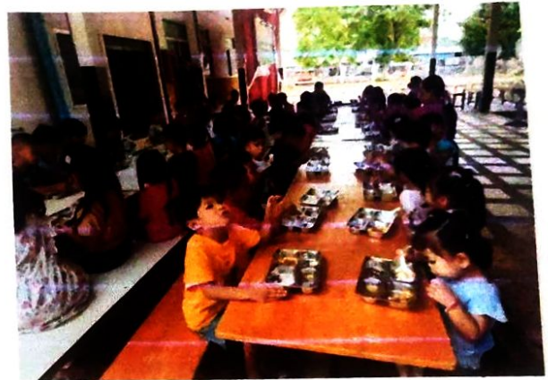
วันพฤหัสบดีที่ ๘ พฤษภาคม ๒๕๖๘