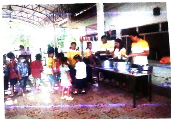
วันอังคารที่ ๖ พฤษภาคม ๒๕๖๘