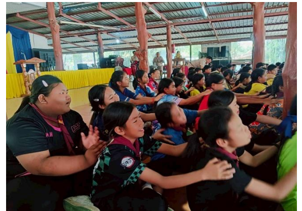
กิจกรรมเข้าฐานผจญภัย