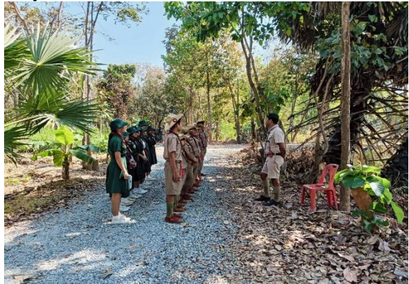
กิจกรรมนันทนาการ