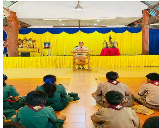
เปิดกองลูกเสือ