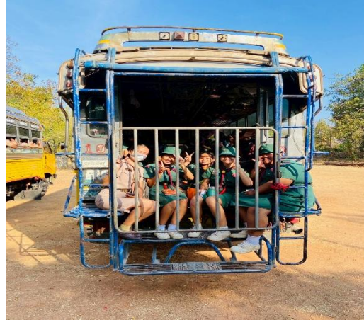
พิธีเปิดการเข้าค่ายลูกเสือ