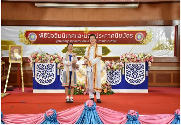
น้องกล่าวอำลาพี่ พี่กล่าวอำลาสถาบัน