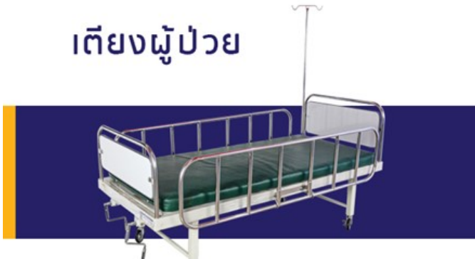
เตียงผู้ป่วย